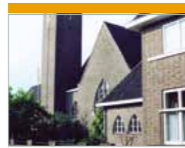
St. Stephanuskerk Eiland 22 Hasselt