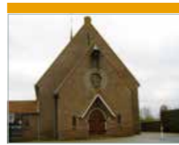
O.L.V. ten Hemelopneming Zuiderzeestraatweg 9 Hatterm