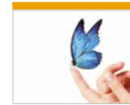
Pastoraal Steunpunt Verrijzenis Zwolle