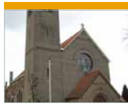
O.L.V. Onbevleete Ontvangenis Oosterholtseweg 2 IJsselmuiden