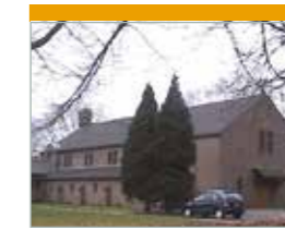
O.L.V. van Altijdd. Bijstand Valkenbergweg 26 Zwolle