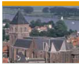
O.L. Vrouwe of Buitenkerk Buiten Nieuwstraat 101 Kampen